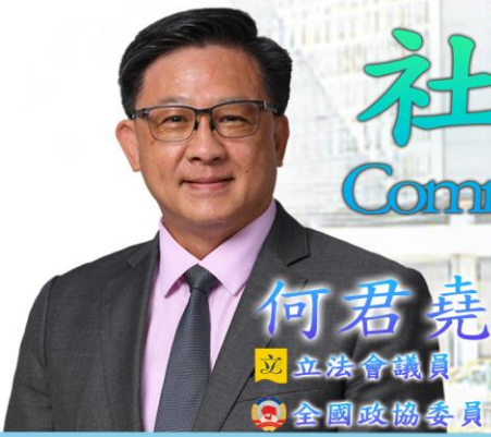
何君堯 立法會議員 全國政協委員