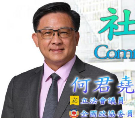
何君堯 立法會議員 全國政協委員