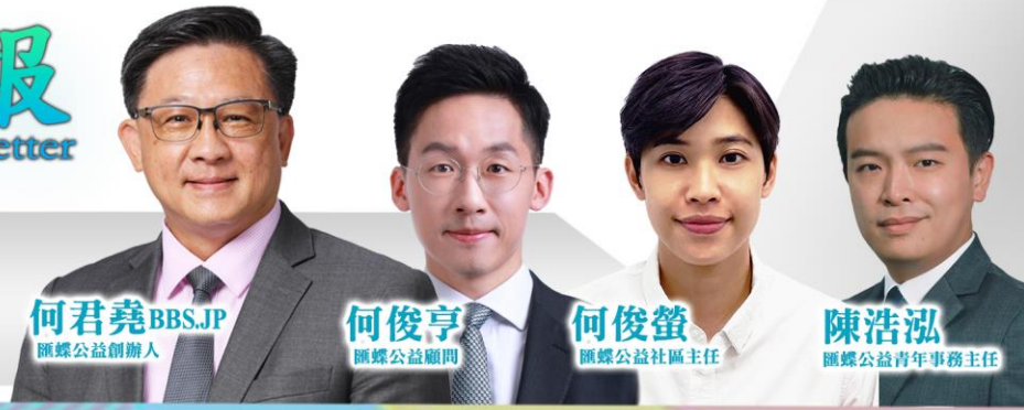
何君堯 BBS,JP 匯蝶公益創辦人