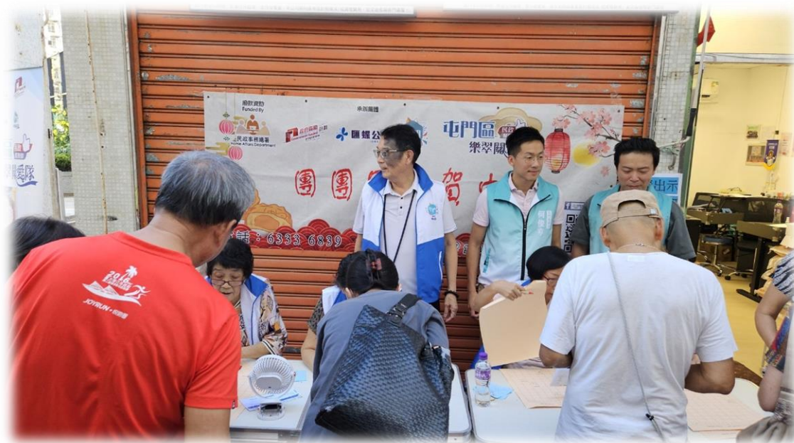
團團圓圓賀中秋 登記月餅派水果活動