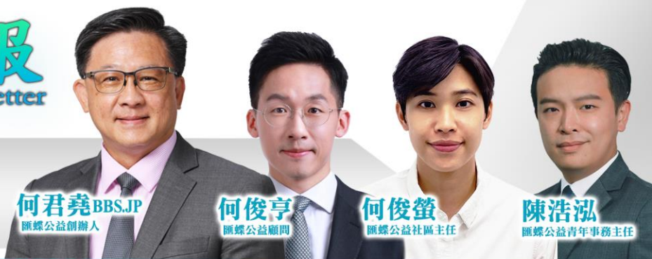
何君堯 BBS,JP 匯蝶公益創辦人